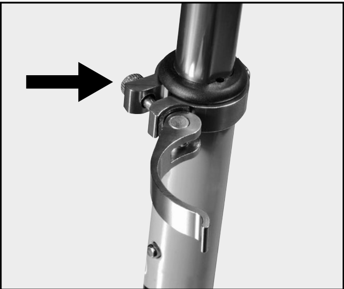
Abb. | Picture | Fig. | fig. | ill. | afb. 5