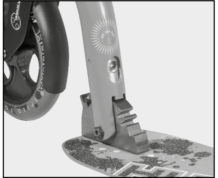
Abb. | Picture | Fig. | fig. | ill. | afb. 2