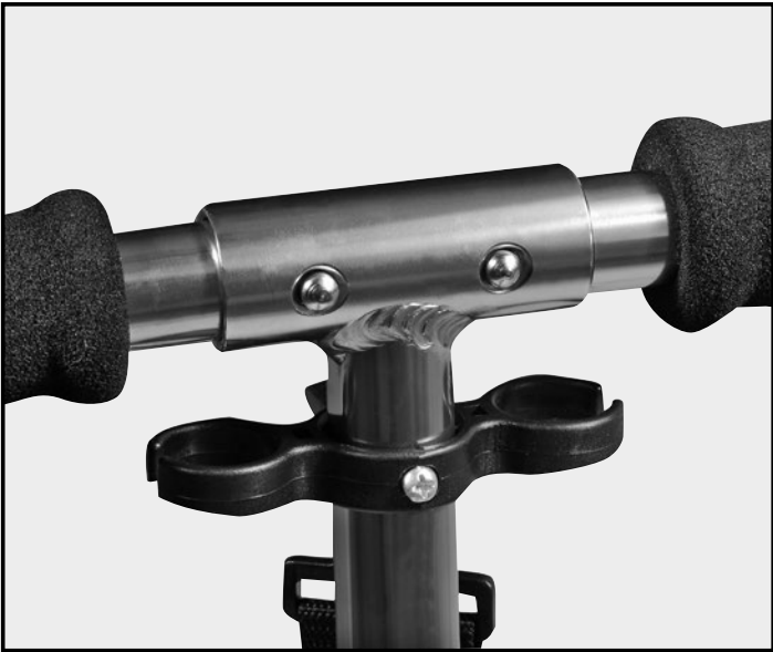
Abb. | Picture | Fig. | fig. | ill. | afb. 3