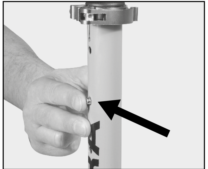
Abb. | Picture | Fig. | fig. | ill. | afb. 6