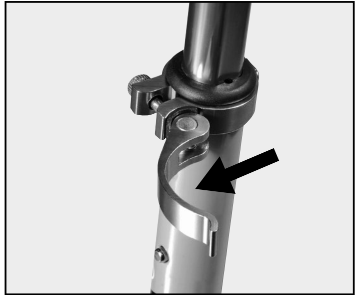
Abb. | Picture | Fig. | fig. | ill. | afb. 4